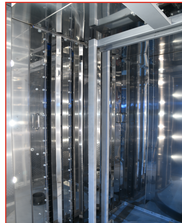
Пекарная камера ротационной печи «Муссон-ротатор» модель 250 МР Супер

- дверь пекарной камеры с двойным остеклением из термостойкого ударопрочного стекла. Внутреннее низкоэмиссионное стекло имеет высокие теплоотражающие свойства и позволяет снизить потери тепла. Уплотнение из силиконового резинового профиля исключает утечку паровоздушной смеси.