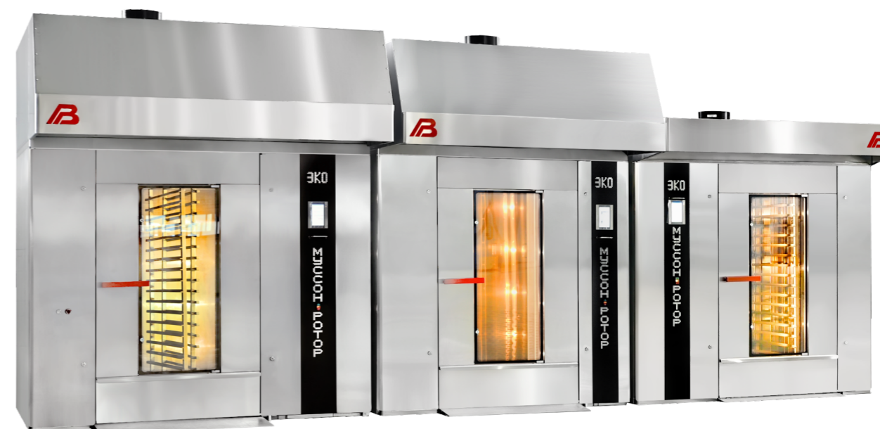
«Муссон-ротор» модель 350

Для повышения энергоэффективности и экологической безопасности печей при разработке был применен ряд инновационных решений, которые позволили приблизить КПД печей к теоретически достижимому максимуму. Внедрена инновационная трехходовая конструкция теплообменника с противотоком, где циркулирующий в печи поток воздуха движется от холодной зоны теплообменника к более горячей, максимально нагреваясь перед поступлением в пекарную камеру, оптимизирована схема движения отходящих газов.