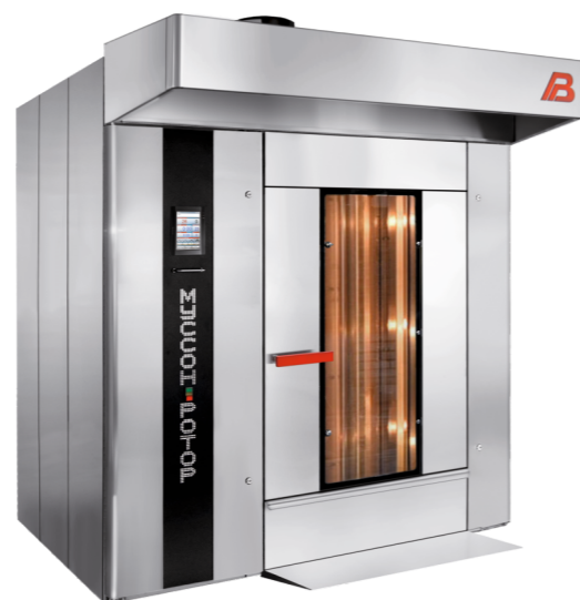
“Муссон ротор” модель 99М-01, 99М-02, 99MP-01, 99MP-02.