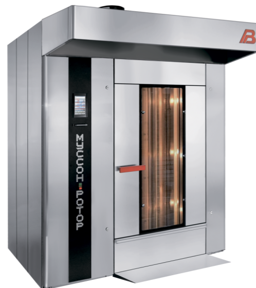
“Муссон ротор” модель 77М-01, 77М-02

- верхний привод вращения стеллажной тележки, передающий вращающий момент через рамку платформы, низкий порог пекарной камеры, короткий пандус, верхний узел фиксации тележки, запатентованный на территории РФ, упрощает закатывание тележки, позволяют избежать встряски тестовых заготовок при закатывании стеллажной тележки, исключают ее смещение во время выпечки