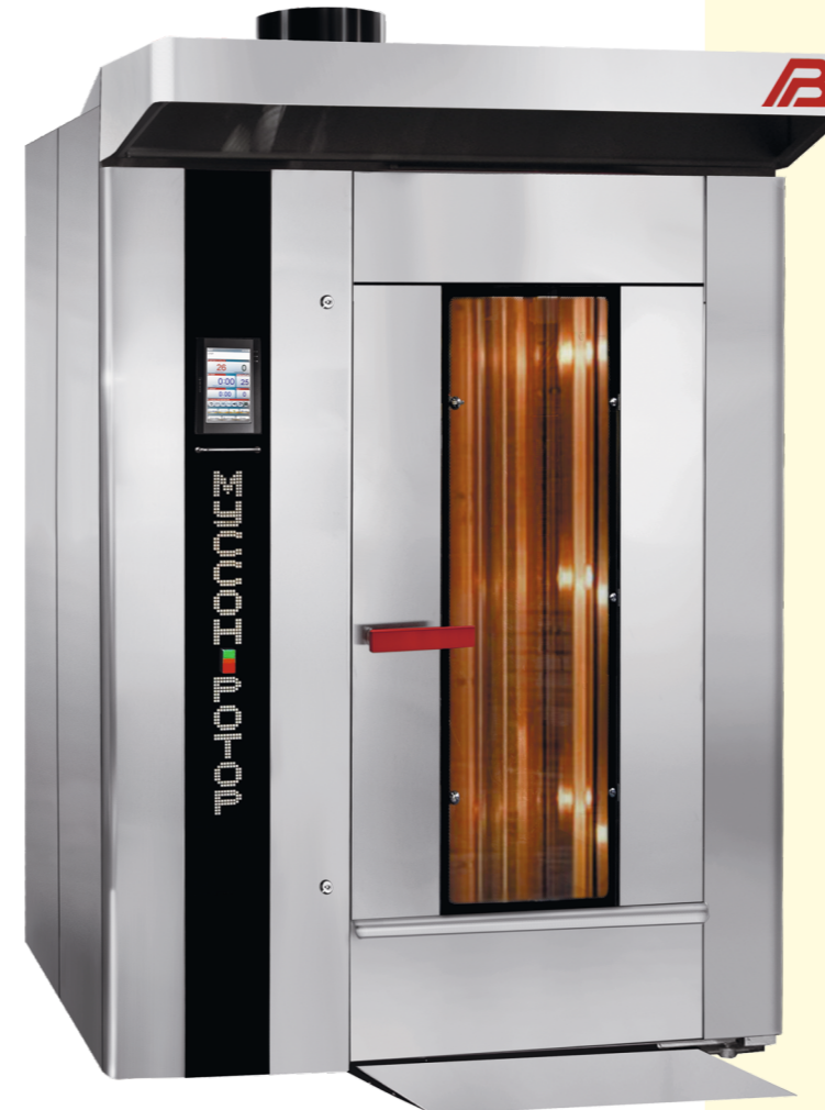
«Муссон-ротор» модель 55-01, 55-02, 55P-01, 55P-02

Multi-purpose rotary ovens (gas, liquid fuel, electric heating)